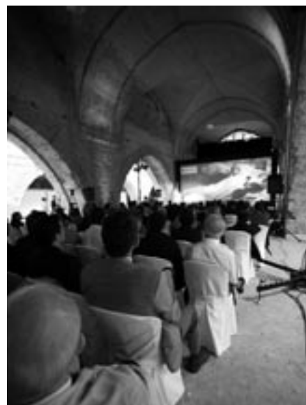
Imagen general del acto.

Se suelen celebrar aniversarios a los 25, a los 50, a los 75. Pero ¿y a los 80? La Confederación Hidrográfica del Guadalquivir lo hizo y, al hacerlo, despertó más dudas e incertidumbres de las que quizá quiso aclarar. ¿Por qué una celebración a los 80? ¿Fue una despedida encubierta o un “que cumplas muchos más”? Parece seguro que la Confederación Hidrográfica del Guadalquivir continuará después del traspaso de competencias a la Junta de Andalucía, pero ¿con qué funciones? ¿Será un organismo relevante para garantizar el principio de unidad de cuenca o la transferencia le restará sus contenidos más relevantes? ¿Se referirán exclusivamente sus competencias a planificación o participará de la explotación de los diferentes sistemas de embalses, muy especialmente de aquellos que comparten varias provincias?