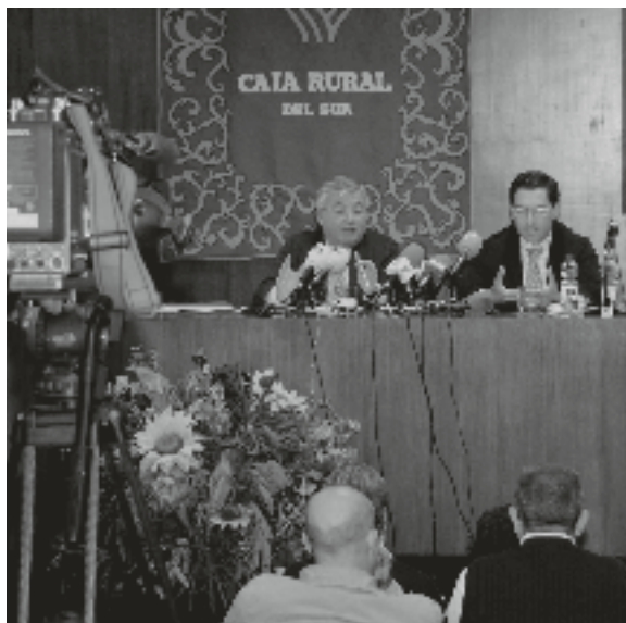
La rueda de prensa para valorar el traspaso del Guadalquivir, celebrada en la Caja Rural del Sur, concitó un gran interés mediático.