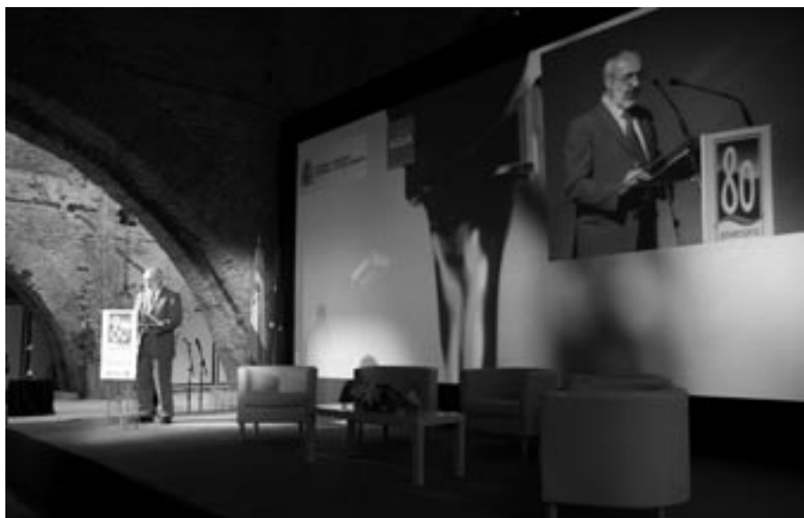
El presidente de la Confederación Hidrográfica del Guadalquivir, Francisco Tapia.

La incertidumbre sobre el futuro de la Confederación Hidrográfica del Guadalquivir marca el acto institucional de conmemoración de su aniversario.