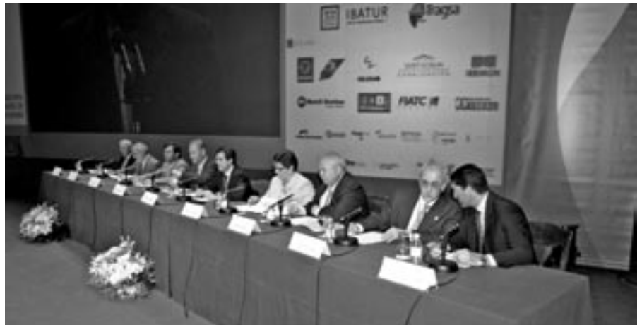
Una imagen de la mesa en el acto de inauguración del Congreso celebrado en Mallorca

En la defensa de su enmienda ante el resto de usuarios de España, los representantes del regadío andaluz explicaron que la nueva Ley del Gobierno de Andalucía no identifica quiénes son los agricultores afectados ni tampoco especifica cuáles son los parámetros límites para la determinación del carácter de especial contaminación, aunque la Agencia Andaluza de Agua ya les ha anunciado que los usos de regadío considerados contaminantes y potencialmente afectados por el impuesto serían 40.000 hectáreas de cultivos de invernadero y fresa, una arbitrariedad de la que Feragua deduce el claro afán recaudatorio de la Junta de Andalucía, que dirige sus miras al regadío teóricamente más rentable, sin justificar ni aportar pruebas de si estos cultivos son real-