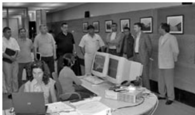
Una instantánea de las visitas de los representantes de Catamarca (izquierda) y Armenia (derecha)

El modelo de las comunidades de regantes españolas se ha convertido en referente internacional y en ejemplo de cómo puede articularse la vertebración del regadío y su participación en la gestión de la política hidráulica. Estos últimos meses hemos recibido la visita de tres importantes delegaciones, del