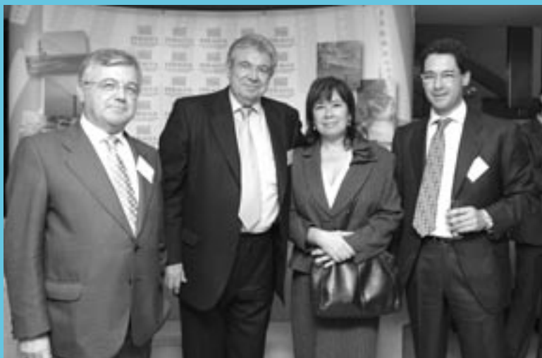
Representantes del regadío con la Ministra de Medio Ambiente

Se le notó a la ministra su vinculación con Sevilla. Tras la clausura del X Aniversario, en la copa que se celebró después, Narbona estuvo simpática, amable y atenta con los representantes del regadío que allí se encontraban. Previamente, en el acto institucional, había halagado a los regantes del Guadalquivir y había comprometido su palabra de que “se ejecutarán todas las obras previstas en el Plan Hidrológico Nacional para el Guadalquivir” y por tanto también la Breña II. También aseguró que los regantes mantendrían la representación que les corresponde en los órganos de gestión y planificación hidráulica, una idea que previamente había sostenido Juan Corominas en su ponencia sobre la transfe-