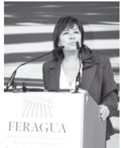
Cristina Narbona durante su intervención

Primero, aplaudiendo el impulso y la iniciativa del regadío de la Cuenca en materia de modernización y calificando a nuestros regantes como “lo mejor pagadores de toda España”. Segundo, asegurando que se ejecutarán todas las obras contempladas en el Plan Hidrológico Nacional para la Cuenca del Guadalquivir, y entre ellas la Breña II. También aseguró la ministra que los regantes tendrán el peso que le corresponde en la gestión y planificación de la política hidráulica, una aseveración que desde luego no hemos visto reflejada en los planes del Gobierno andaluz para la AAA.