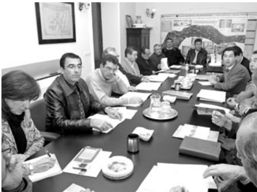
Un momento de la reunión en la que se fraguó el acuerdo contra los Estatutos de la nueva AAA

En las distintas ruedas de prensa celebradas, los representantes del regadío dejaron claro que no se oponen a la participación de otras asociaciones y organizaciones vinculadas indirectamente con el agua (organizaciones profesionales agrarias, consumidores, usuarios, empresarios, sindicatos, etc.), pero siempre que esta presencia no menoscabe la representación de los concesionarios de agua, que, como gestores y paga-