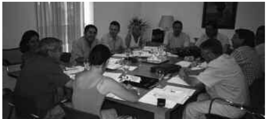
Reunión de la Junta General de la Plataforma del Guadalquivir celebrada el pasado mes de julio

En sus argumentos, la Plataforma destaca igualmente que la construcción de la Breña II será muy importante para que Andalucía pueda cumplir la letra y el espíritu de la Directiva Marco de Aguas. Este